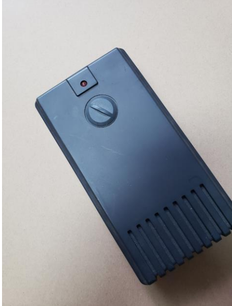
IDS-I3A 自动机用电动螺丝刀专用电源