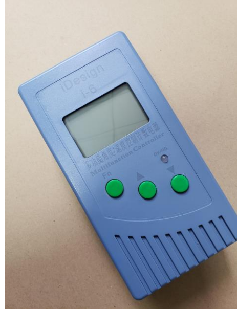
IDS-I6A 角度速度控制多功能数显电源